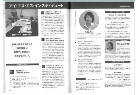
▲前号の同企画掲載ページ

★10月17日(火)までに1色1ページ以上のお申し込み ⇒10月31日(火)までに編集部にて講座取材を実施。